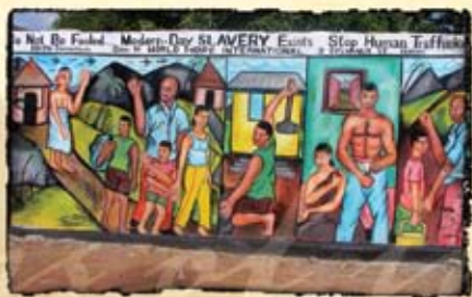
Une peinture murale en Afrique de l'Ouest met en garde les membres de la collectivité contre le trafic humain.

« Tu ne profaneras point ta fille en la livrant à la prostitution, de peur que le pays ne se prostitue et ne se remplisse d'infamie. » ~ Lévitique 19:29 ~