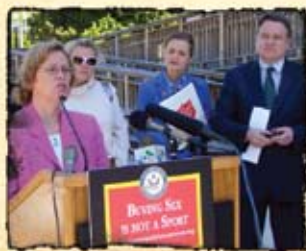
Des avocats à Washington, DC, dénoncent la demande de trafic de femmes à des fins sexuelles lors du championnat du monde de football en Allemagne, en 2006.

On estime à 100 000 voire jusqu'à 150 000, le nombre de victimes de l'industrie du sexe aux États-Unis (K. Bales). De ce nombre, moins de 1 000 ont reçu de l'aide des autorités policières à l'échelon fédéral et local et ce, malgré la mise sur pied de services à l'intention des victimes du trafic sexuel, en 2001. (Département de la Justice des États-Unis)